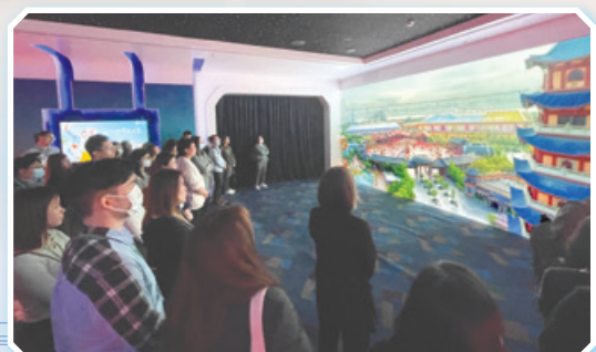
學員認真地觀賞影片

一般職系處將繼續為同事提供適切的培訓，讓員工能發揮潛能、盡展所長，從而提高整體工作效率和成效，並確保公務員隊伍與時並進，為市民提供優質服務。