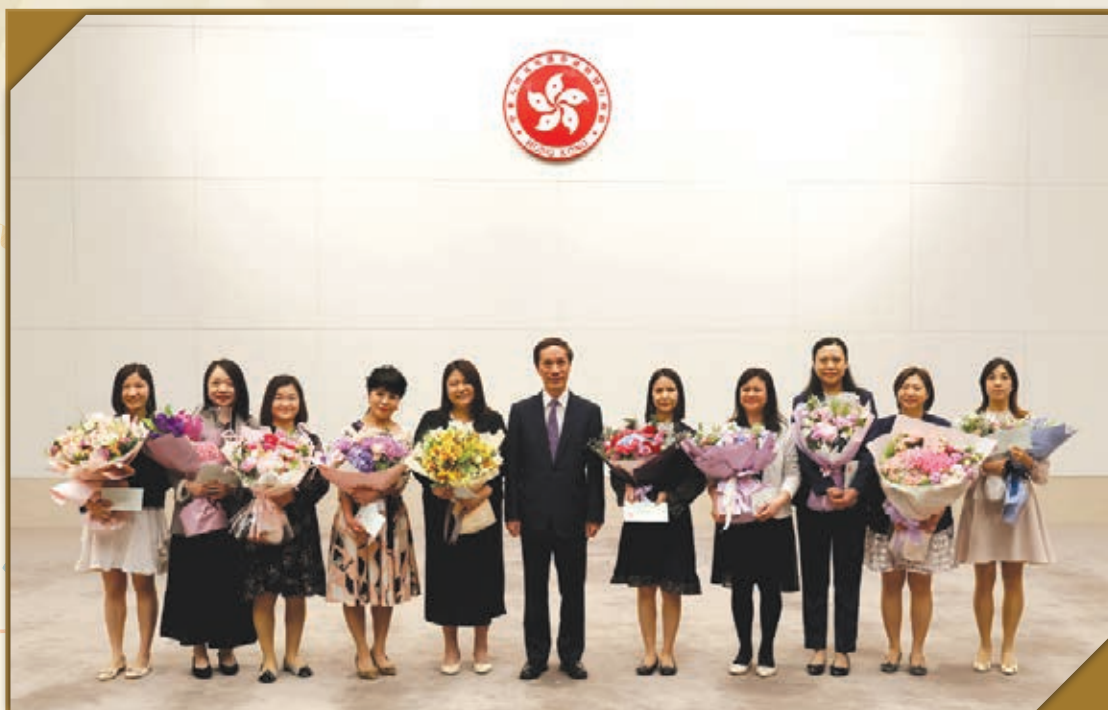
一般職系處長頒發升職信予晉升高級私人秘書的同事