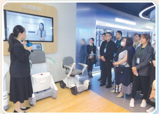
學員參觀位於深圳的科技企業

課程內容包括課堂培訓和實地考察兩部分，前者部分是以課堂講授形式教導學員人力資源管理的理論與實踐應用，而後者部分則通過參觀訪問不同企業，讓學員了解商業環境如何影響企業，認識私營企業的商業模式、策略、組織結構和運作方式，學習如何調整人力資源政策和流程以支持企業增長，以及從不同角度探討人力資源管理問題。