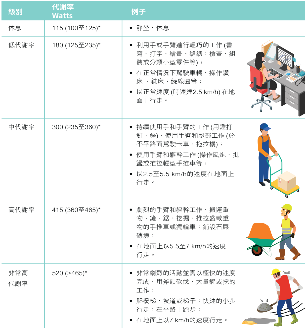
表1. 不同工作類別的代謝率

資料來源：ACGIH 2019 TLVs；*BS EN ISO 7243:2017