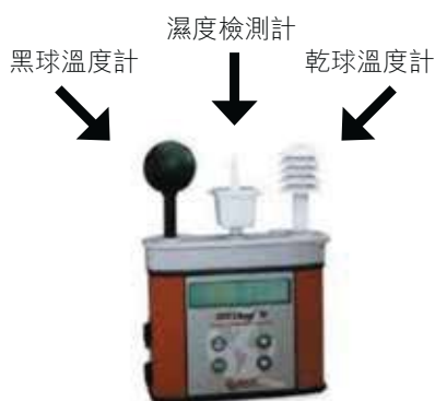
圖4. 濕球黑球溫度計

「熱壓力評估核對表」能夠幫助我們對工作地點的熱壓力風險作初步評估，並作出合適的控制措施。若需要準確了解工作環境的熱壓力情況，或檢討措施能否有效控制風險，便需進一步採集相關數據作分析。現時有多種不同的評估熱壓力的方法，其中濕球黑球溫度 (Wet Bulb Globe Temperature, WBGT)，是較常見的方法，用來監測人體於酷熱環境下所承受的熱壓力。WBGT已被國際標準化組織 (International Organization for Standardization, ISO) 及美國政府工業衛生師協會 (American Conference of Government Industrial Hygienists, ACGIH) 所採用，作為評估熱壓力的指標 (BS EN ISO 7243:2017; ACGIH - Heat Stress and Strain Threshold Limit Value, TLV 2019)。以下簡略介紹 WBGT 的概念和計算方法。WBGT 是一個綜合指數，主要透過綜合量度不同的溫度而得出，以反映當時環境對人體所造成的熱壓力。WBGT 指數包括 (1) 室內 (非曝露於太陽光下) 及 (2) 戶外 (曝露於太陽光下) 兩種計算方法。數值可由濕球黑球溫度計量度 (圖4)。