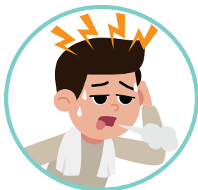
口渴、頭痛、疲倦、 噁心及嘔吐

當身處酷熱環境時體溫會隨之上升，身體需要增加皮膚的血流量及排汗來散熱。如果環境的溫度過高或因體能活動而產生大量熱力，而身體的生理調節未能有效控制體溫時，便可能會引致與高溫有關的疾病。根據衛生防護中心，與高溫有關的疾病包括由較輕微的熱疹及熱痙攣到嚴重的熱暈厥和熱衰竭等等，