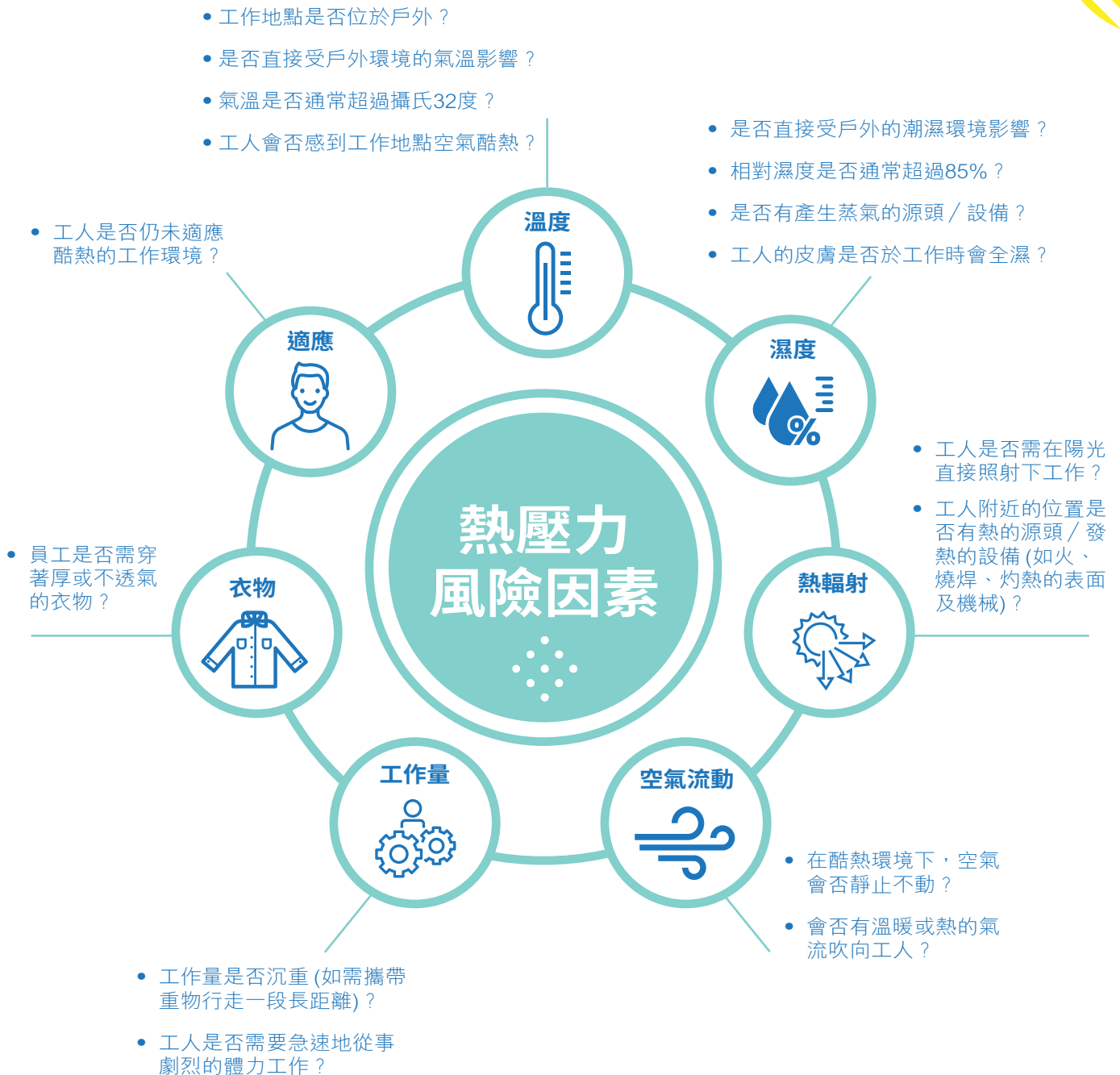
圖3. 工作地點的中暑風險因素

僱主可委任一名熟悉工作地點和工作情況，並對熱壓力有基本職安健認識的人，以熱力評估核對表進行風險評估。核對表以是非題為本，「是」表示可能有潛在的熱壓力風險，愈多問題的答案為「是」，則代表工作地點潛在的熱壓力風險愈高。各風險評估因素的考慮要點如下：